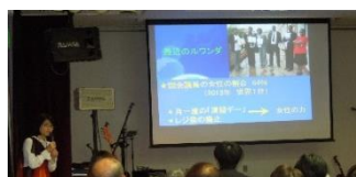
ルワンダ支援についての報告

メンバー (満月堂 HP より転載) ろっぼー ボーカル、ギター、フラマン まっちゃん ボーカル、ギター、カホン いけさん コーラス、ベース