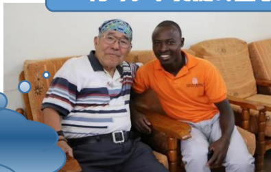
里親と里子の対面