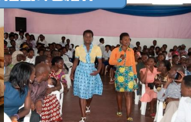
ファッションショーで卒業作品を 披露する生徒