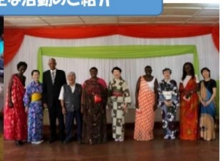
ニューホープ技術専門学校を訪問