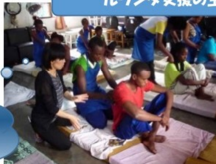
マッサージ技術指導の様子