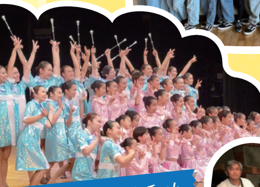
フェニックスバトンチーム