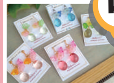
『響け! ユーフォニアム』 キャラクターパネル特別展示も!