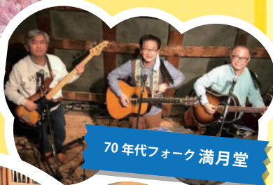
70年代フォーク 満月堂