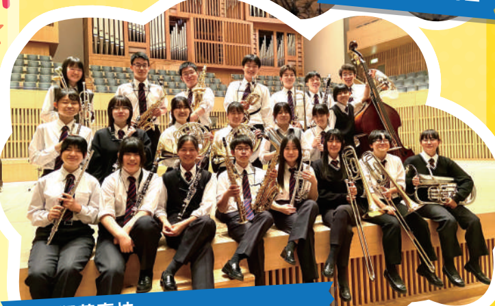
京都翔英高校 吹奏楽部 & チアリーダー部 STAIRS